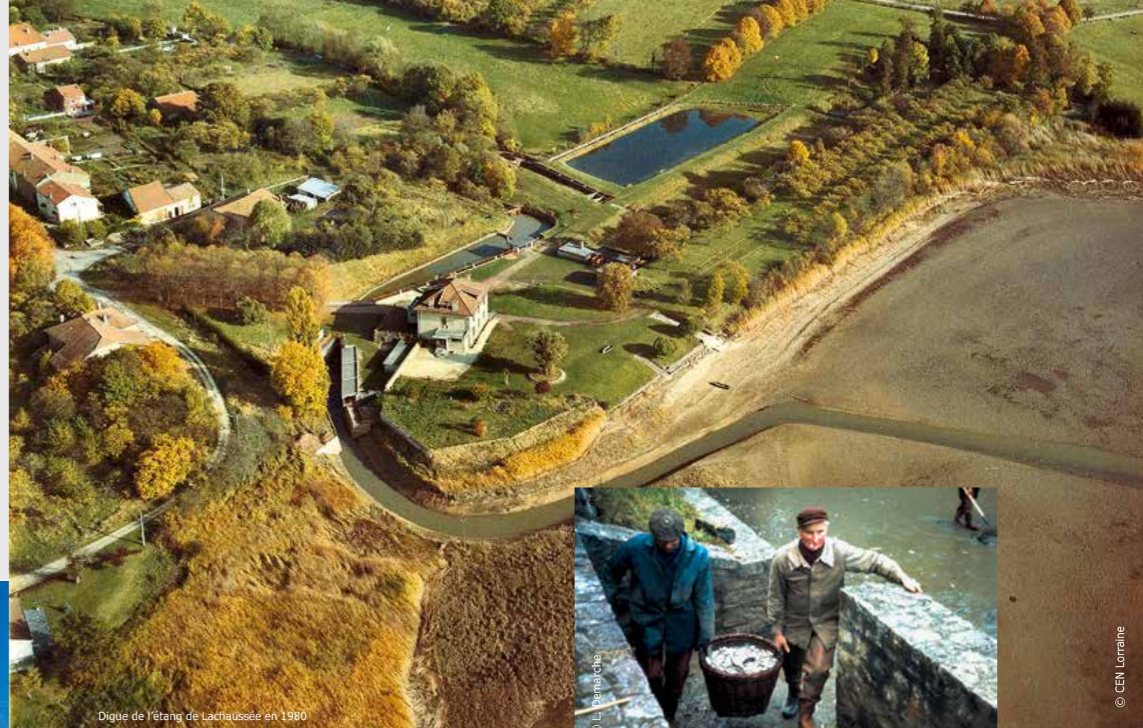
Digue de l'étang de Lachaussée en 1980